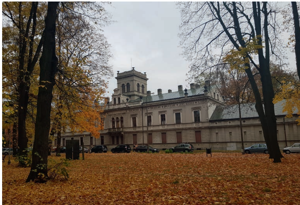
Fotografia 2. Pałac Scheiblera przy placu Zwycięstwa, obecnie siedziba Muzeum Kinematografii – ujęcie od frontu z perspektywy skweru im. L. Niemczyka oraz od strony tylnej