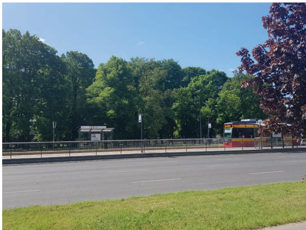
fot. K. Smętkiewicz, czerwiec 2023 r.

Fotografia 3. Plac Zwycięstwa przedzielony al. Piłsudskiego, widok na część południową placu ze skwerem L. Niemczyka