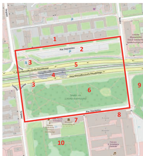
Rycina 2. Plac Zwycięstwa w Łodzi wraz z otoczeniem

1 – domy robotników na placu Zwycięstwa (fot. 4), 2 – parking (fot. 4), 3 – przejście podziemne pod al. Piłsudskiego, 4 – przystanek tramwajowy Piłsudskiego–Targowa (fot. 3), 5 – al. Piłsudskiego jako jedna z głównych arterii miasta (fot. 3), 6 – skwer im. L. Niemczyka (fot. 5), 7 – pałac Scheiblera (obecnie Muzeum Kinematografii; fot. 2, 5), 8 – budynki pierwszej fabryki Scheiblera tzw. Centrala (fot. 1, 5), 9 – park Źródlika I, 10 – park Źródlika II