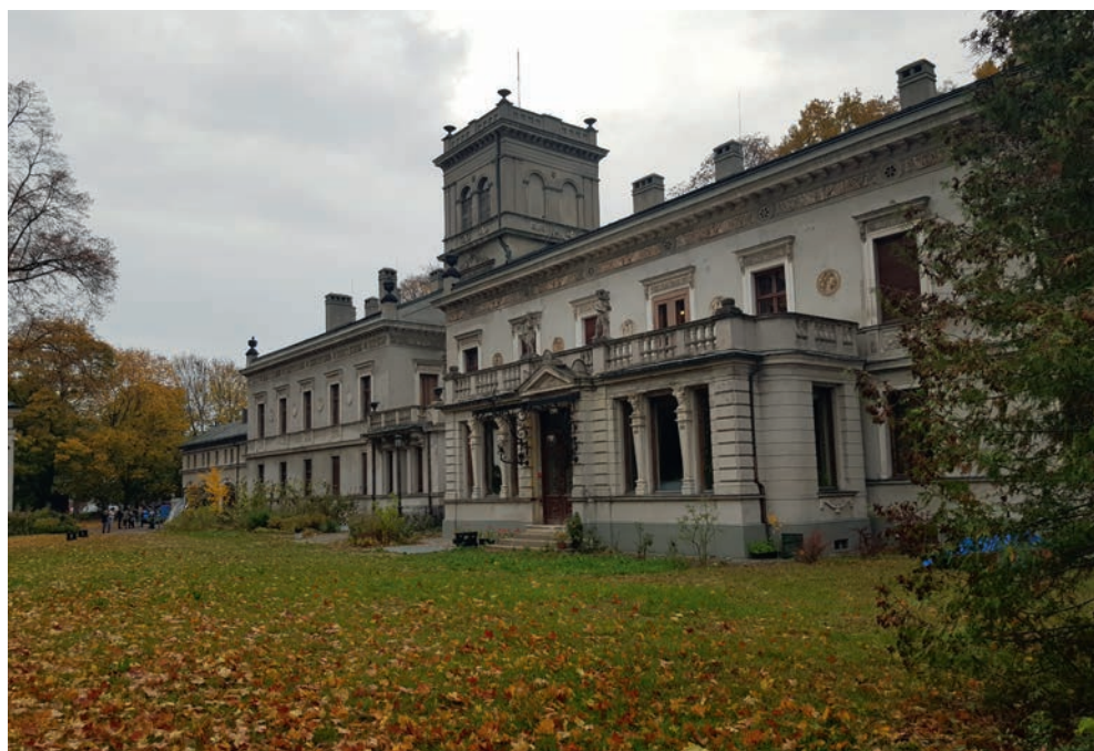
październik 2022 r.