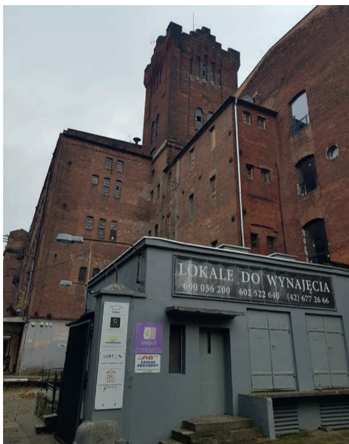
fot. K. Smętkiewicz, październik 2022 r.