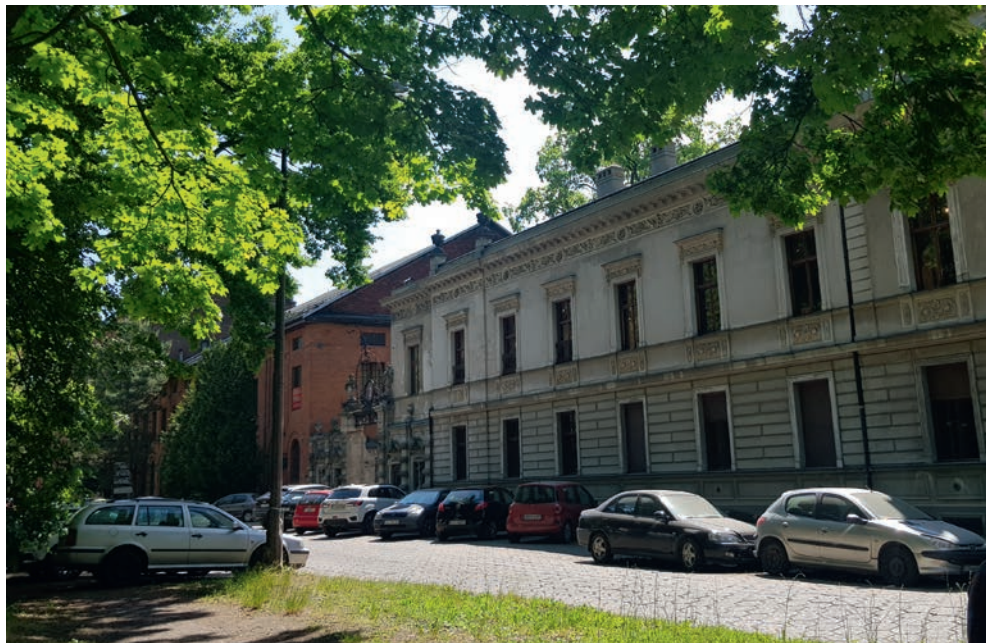
Fot. K. Smętkiewicz, czerwiec 2023 r.