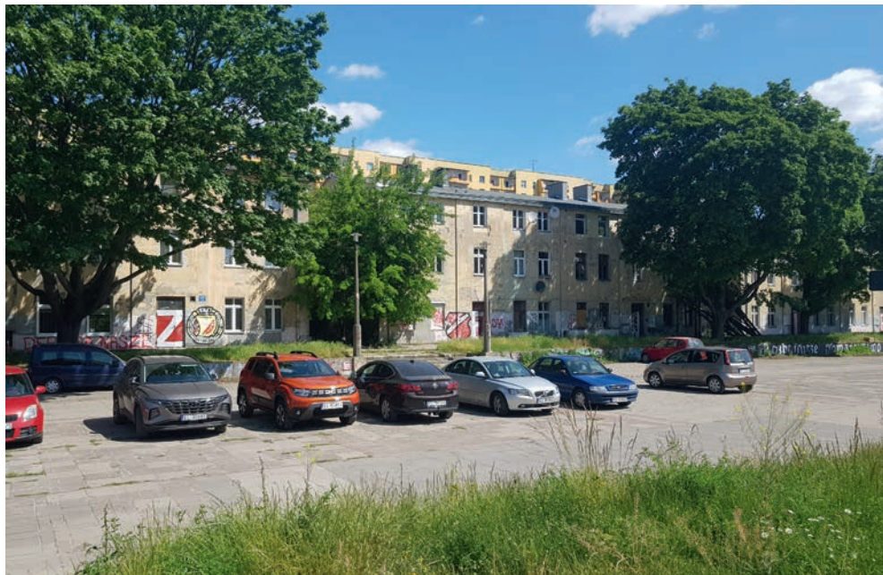
czerwiec 2023r .