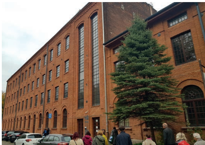
Fotografia 1. Budynek pierwszej przędzalni K. Scheiblera przy placu Zwycięstwa 2 – tzw. Centrala