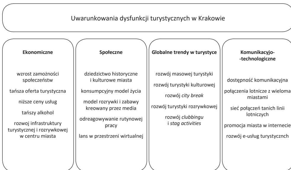
Ryc. 2. Uwarunkowania rozwoju dysfunkcji turystycznych w Krakowie