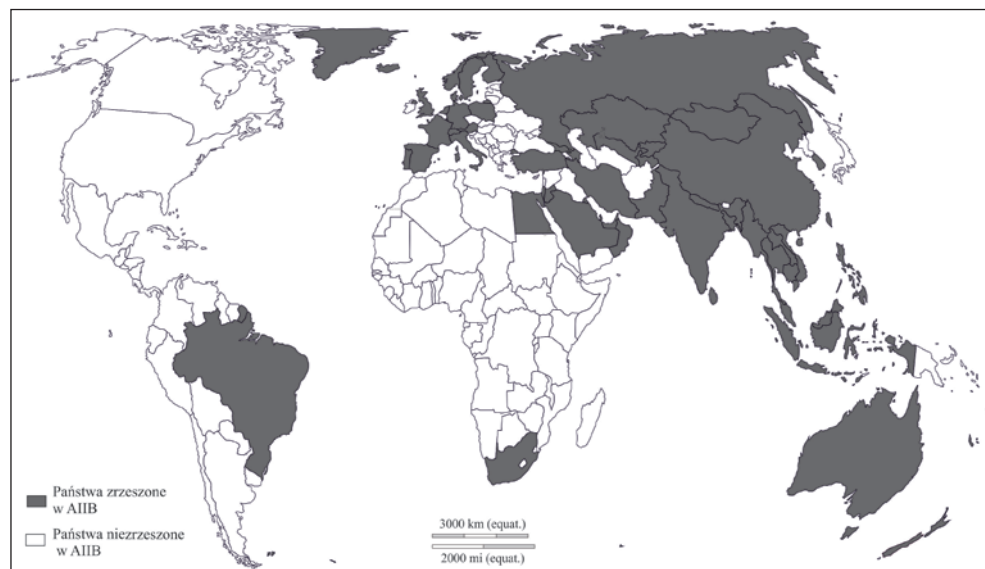
Ryc. 1. Państwa zrzeszone w Azjatyckim Banku Inwestycji Infrastrukturalnych