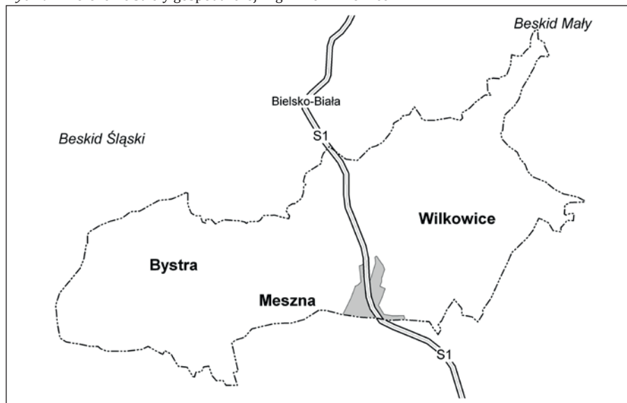
Rycina 1. Położenie strefy gospodarczej w gminie Wilkowice