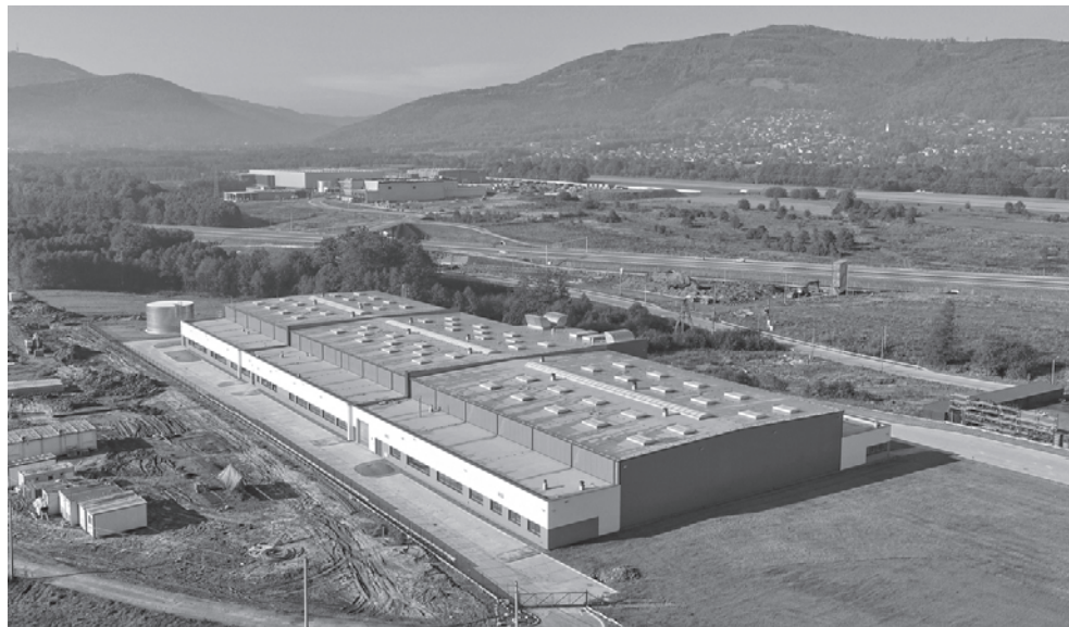
Fotografia 1. Zakład firmy Mika, w głębi Lenko i sąsiadujące zakłady, na tle Beskidu Śląskiego i sołectwa Meszna