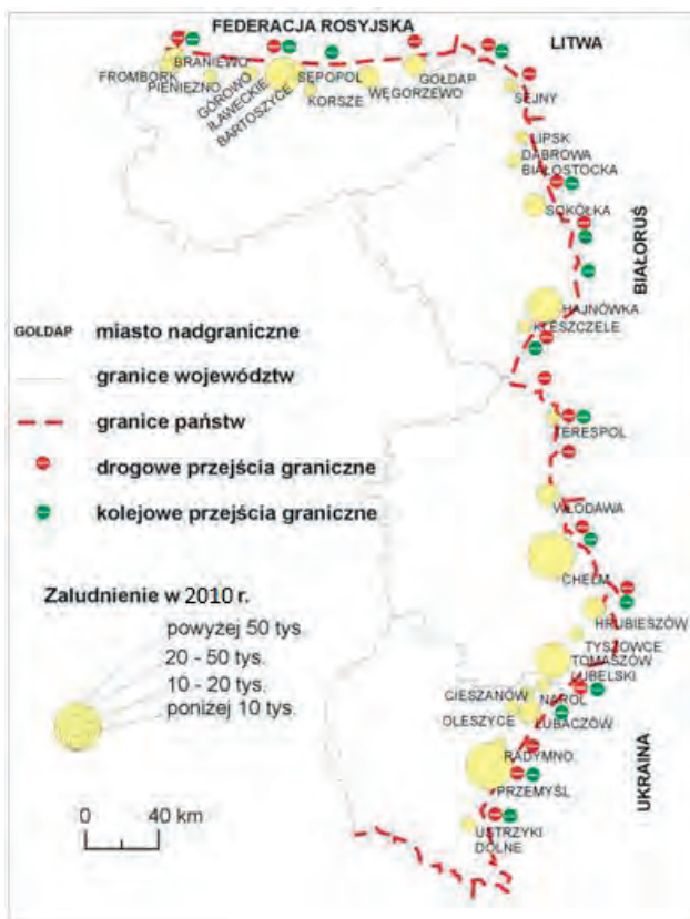
Ryc. 1. Obszar badań

Zakres przestrzenny pracy obejmuje Polskę północno-wschodnią i wschodnią, sąsiadującą poprzez granice państwowe z Federacją Rosyjską (Obwód Kaliningradzki), Litwą, Białorusią i Ukrainą. Szczegółowe badania i analizy zostały przeprowadzone dla 28 miast usytuowanych w strefie nadgranicznej (ryc. 1).