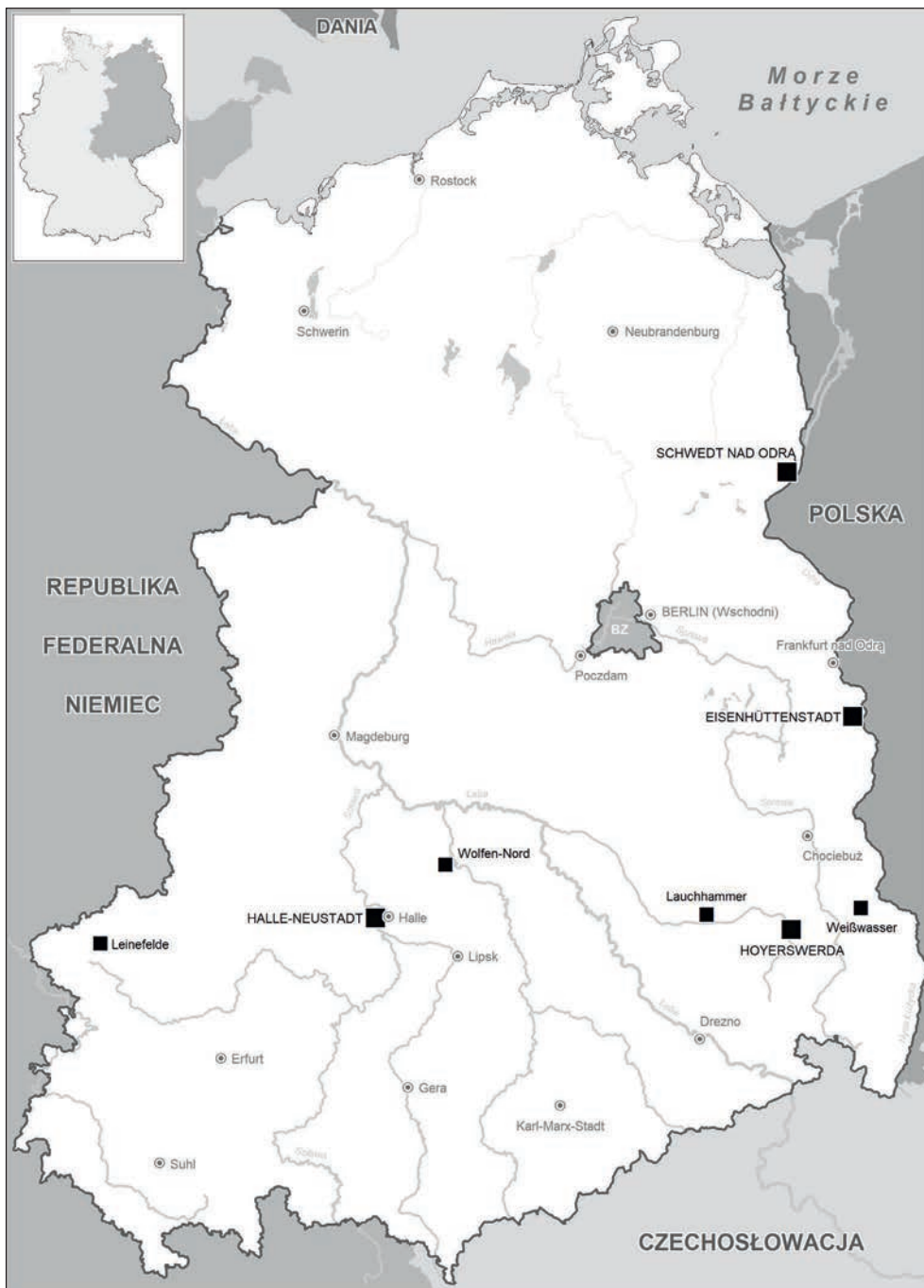
Rycina 1. Przemysłowe „miasta socjalistyczne” w Niemieckiej Republice Demokratycznej (1949–1989)