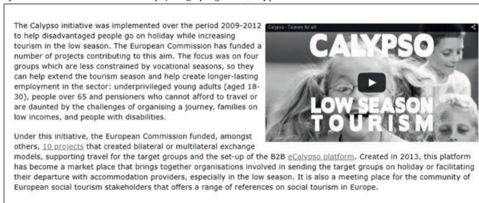
Rycina 2. Strona internetowa europejskiego programu „Calypso”